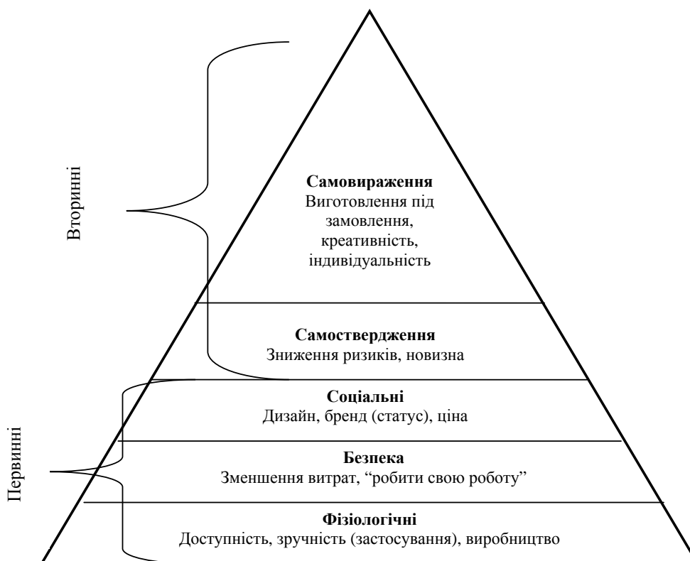
Рис. 2. Ієрархія цінності молокопродукції для клієнта Досліджено авторами

Проведення теоретичних досліджень формування цінності для клієнта зумовлюють необхідність їх практичного підтвердження. В результаті здійсненого дослідження на прикладі молочної продукції ми ранжували цінності для клієнта відповідно до задоволення потреб (рис. 2).