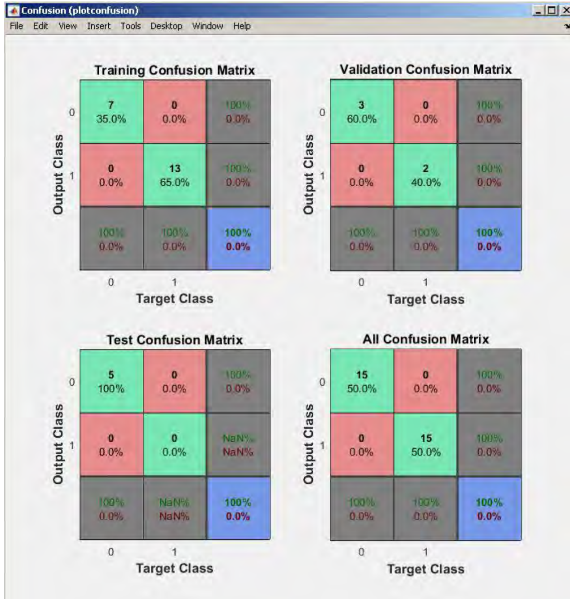
Рис. 2. Результат тестування роботи динамічної нейронної мережі

Для навчання нейронної мережі вибрано 20 пар входів-виходів (елементів), з них 13 елементів з резонансом та 7 елементів без резонансу, які були успішно запам'ятовані. При валідації вибрано 5 елементи з них 2 елементи з резонансом та 3 без резонансу, які були успішно розпізнані. Як тестувальні приклади було вибрано 5 елементів без резонансу, і всі вони були успішно розпізнані.