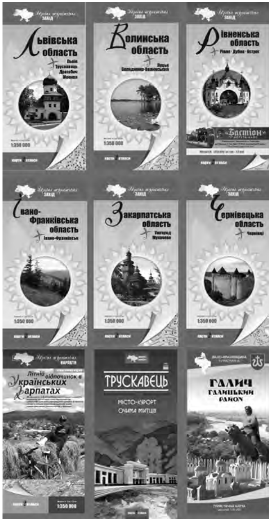
Рис. 2. Вибрані туристичні карти НВФ «Карти і Атласи»

2012 року виданням карти «Трускавець. Місто-курорт очима митців» (м-б 1 : 7 000) започаткована серія «Курорти України». Її продовженням у 2017 р. стало видання «Борислав. Східниця» (м-би 1 : 30 000, 1 : 12 000).