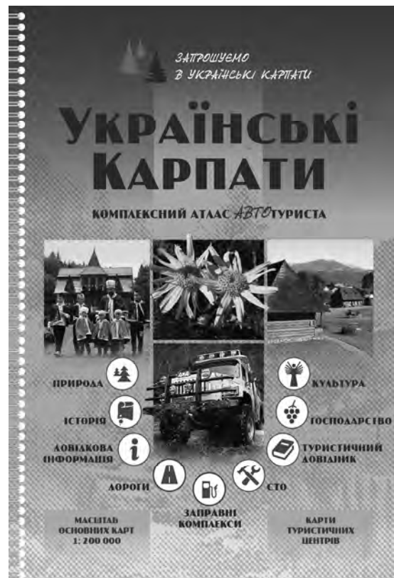
Рис. 3. Українські Карпати. Комплексний атлас автотуриста

Фірма «Карти і Атласи» долучилась також підготовкою картографічних матеріалів до таких робіт інших видавництв як «Гроші України» (Національний банк України, м. Київ), мапа-путівник «Святині України» (Патріарший паломницький центр УГКЦ, м. Київ), «Україна. Природа, населення, економіка» (Федір Заставний, «Апріорі», м. Львів), «ВелоКарпати» і «ВелоЗакарпаття» («АССА», м. Харків), мапи-путівники «Бойківщина», «Гуцульщина» і «Лемківщина» (туроператор «Відвайди», м. Львів) та ін. Варта уваги також участь фірми у створенні картографічних творів для експозицій Львівського історичного музею, зокрема відділу Національно-визвольної боротьби.