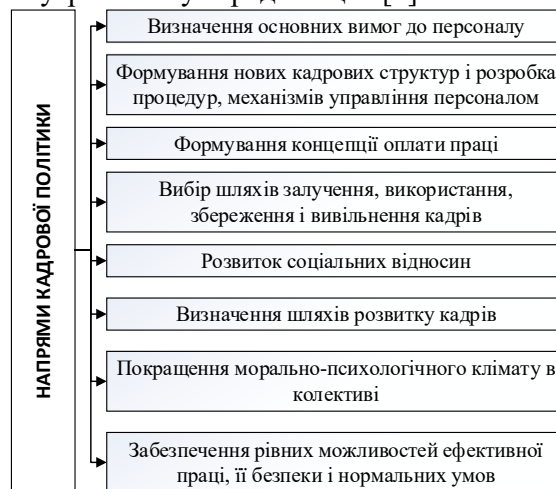
Рис. 1. Напрями кадрової політики підприємства

Кадрова політика підприємства – це система роботи з персоналом, що об'єднує різні форми діяльності й має на меті створення згуртованого й відповідального високопродуктивного колективу для реалізації можливостей підприємства адекватно реагувати на зміни в зовнішньому і внутрішньому середовищах [4].