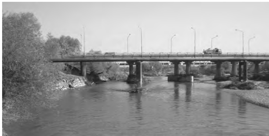
Рис. 5. Розмивання основи під опорами автомобільного мосту

Цей фактор є достатньо небезпечним, оскільки у цьому місці проходять транспортні артерії м. Стрий. Якщо не взяти до уваги швидкі процеси ерозії річки, то це може призвести до руйнування технічних споруд. Ілюстрацією цього є рис. 5, де на показано підмивання опор мосту на досліджуваній ділянці ріки.