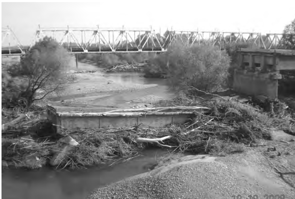
Рис. 1. Стрий: наслідки паводка 2008 року в районі залізничного моста

Потужний паводок на ріках Карпатського регіону відбувся в липні 2008 року. За своїми параметрами він перевищував рівні води паводку 2 % забезпеченості. У результаті цього паводка матеріальні збитки у Львівській області становили понад 340 млн. гривень. Значні руйнування і матеріальні втрати від паводка були в Стрийському районі, по території якого протікає р. Стрий (рис. 1).