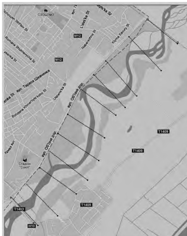
Рис. 2. Схема планової та висотної основ, а також розміщення поперечних профілів

Вимірювання проведені на відрізку річки завдовжки понад 3 кілометри на одинадцяти поперечних профілях. Для забезпечення промірних робіт прокладено магістральний хід планової основи методом полігонометрії 2-го розряду, згідно з вимогами [7]. Цей хід опирається на чотири пункти полігонометрії 4 класу, які розташовані попарно поблизу двох мостових переходів, на кінцях ходу полігонометрії. Закріплення цих пунктів здійснено геодезичними знаками (бетонними тетраїдами). Висоти цих точок визначено нівелюванням III класу (рис. 2). Точки, з яких проводилися вимірювання, на морфостворах закріплені знаками довготривалого зберігання, висоти цих пунктів полігонометрії другого розряду визначені із нівелювання IV класу. Кути і довжини ліній вимірювали електронним тахеометром Leica TCR 407 power. Поперечні профілі вимірювали створно-лінійним методом. Для забезпечення точності виміри в створах поперечних профілів проводилися з кроком, не більшим ніж 20 метрів між точками. Глибини в руслі вимірювались за допомогою гідрометричної штанги.