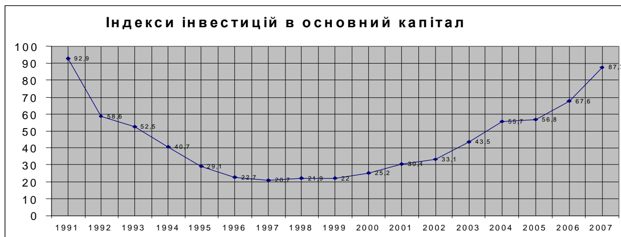
Рис. 2. Індекси інвестицій в основний капітал

де ЛП – розмір лізингових платежів, А – амортизаційна складова, С – відрахування в страхову компанію, ВЛ – відрахування лізинговій компанії.