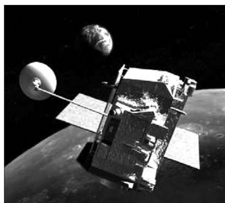
3. LRO — штучний супутник Місяця

ЛЛС не обмежується максимальною відстанню у 20000 км для навігаційних супутників. Проводяться також лазерні спостереження Місяця, тобто відбивачів, залишених місіями Аполон та Луноход, а також у 2009 році і супутника Місяця — космічний апарат LRO. Завдання ЛЛС-спостережень LRO — прецизійно визначити орбіти супутника. Бортова система супутника складається із приймального телескопа, що захоплює лазерний імпульс наземної ЛЛС-станції, та оптоволоконного кабеля, що передає його до лазерного висотоміра. Вже він реєструє час приходу лазерного сигналу,