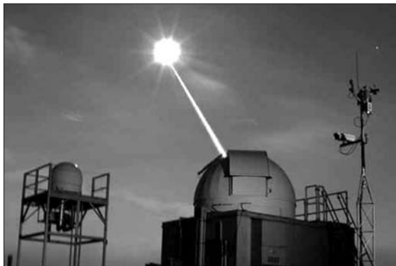
1. Лазерна локація Місяця

передає у відповідні центри, де дані коректують приведення до центра мас супутника, вплив атмосфери (викривлення та сповільнення поширення