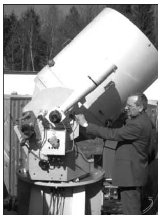
5. Телескоп ТПЛ-1М

2002 р. ЛЛС-станція увійшла до Міжнародної мережі лазерних станцій ILRS під акронімом LVIL, із міжнародним кодом си-