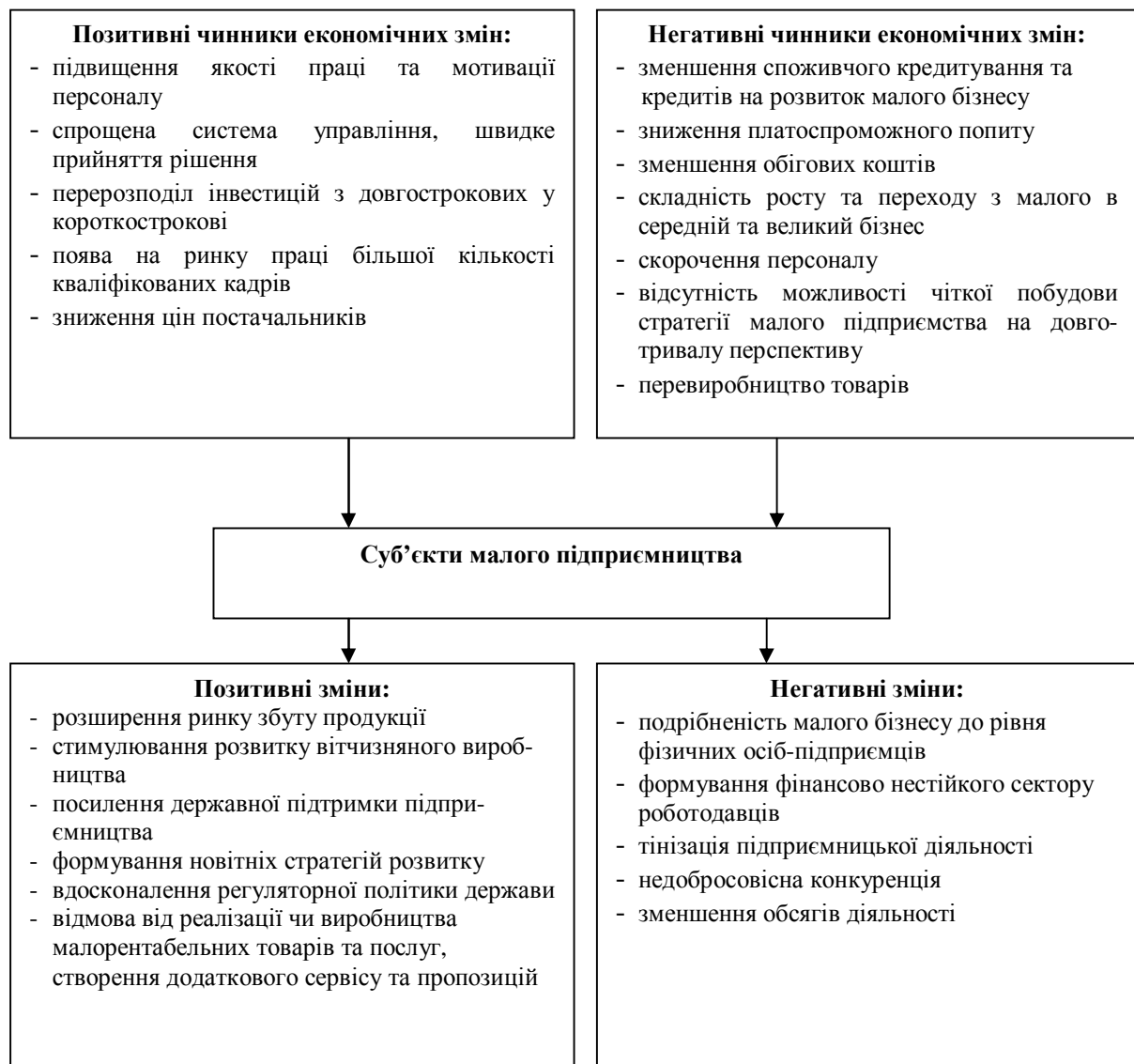
Рис. 2. Вплив кризових явищ на зміни у підприємницькому середовищі

Важливою перевагою малого бізнесу в кризових умовах є можливість швидкого відродження, оскільки не потребує великого стартового капіталу, тому негайно розпочинає виробництво, задовольняючи нові потреби ринку, забезпечуючи додатковими доходами значну частину населення.