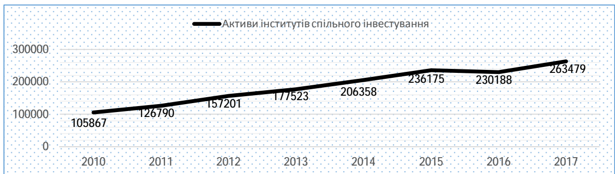
Рис. 2. Активи інститутів спільного інвестування з 2010 по 2017 рр.

В Україні активи інститутів спільного інвестування помірно зростають, але в переломному для країни моменті з 2015р. по 2016 р. цей показник падає. Дані зміни можна пояснити зростанням за останні роки індексів українських фондових бірж, відтоком інвесторів і збільшення доходності, які подані в табл. 1 [3].