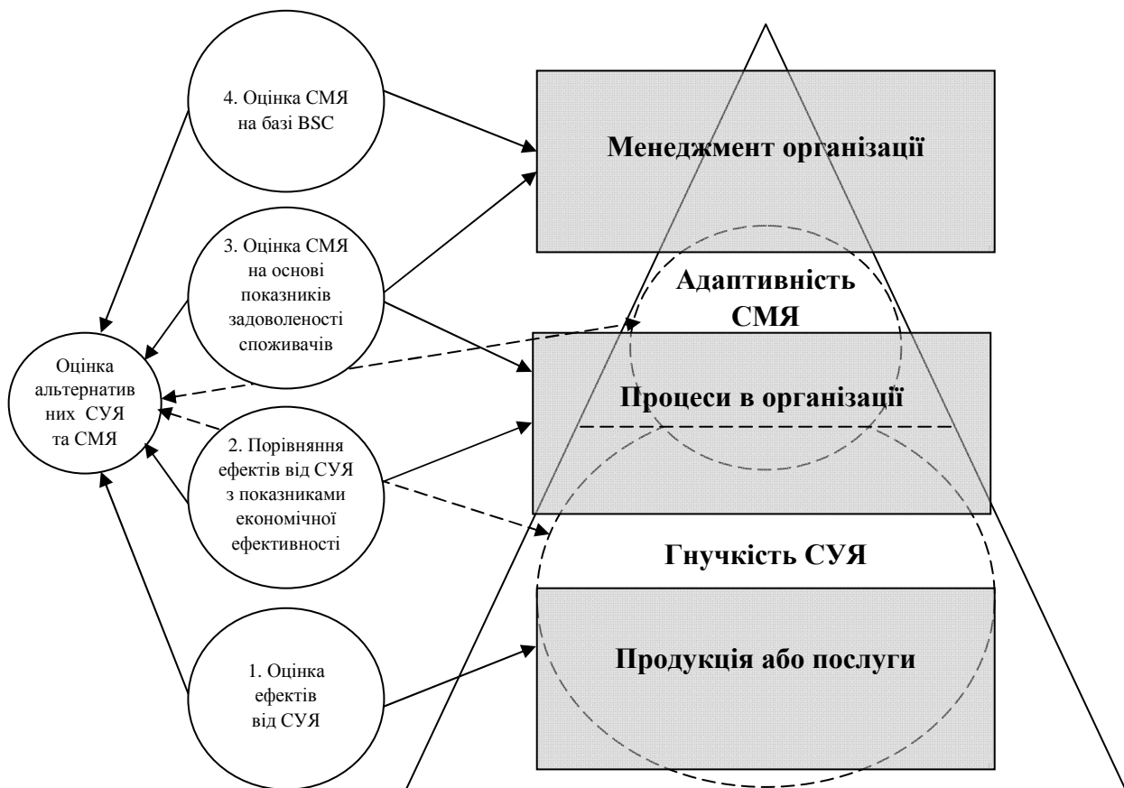
Рис. 3. Схематична модель порівняльного оцінювання гнучкості систем управління якістю та адаптивності менеджменту якості підприємств

По-четверте, менеджмент підприємств може скористатися методикою Збалансованої системи показників Д. Нортон і Р. Каплана (BSC) [12, с. 72]. На думку багатьох дослідників ефективності систем менеджменту якості, саме врахування інтересів груп впливів та принципу постійного розвитку організації дає змогу найбільш об'єктивно виявити вплив систем менеджменту якості на діяльність підприємства [1, с. 228]. Такий підхід до оцінювання систем якості вимагає проте багато часу на формування системи такого оцінювання, складними є як збирання, так і опрацювання емпіричних та експертних даних й інформації про діяльність підприємства.