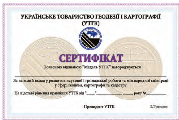
Відзнака Товариства "Медаль УТГК"