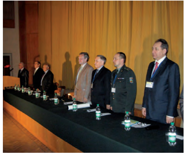
Президія одного з МНТК "Геофорум". Ці конференції організовує ЗГТ