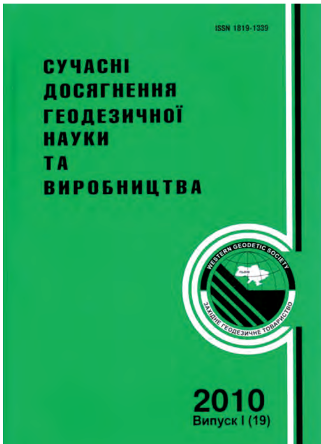
Один зі збірників наукових праць ЗГТ