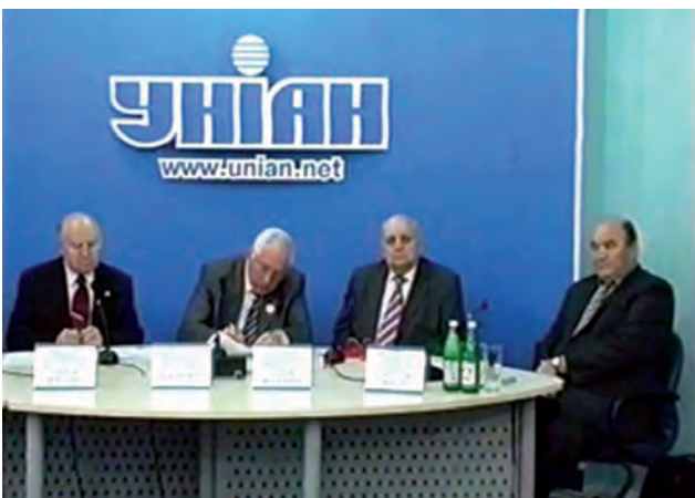
Прес-конференція в УНІАН на захист геодезичної галузі України