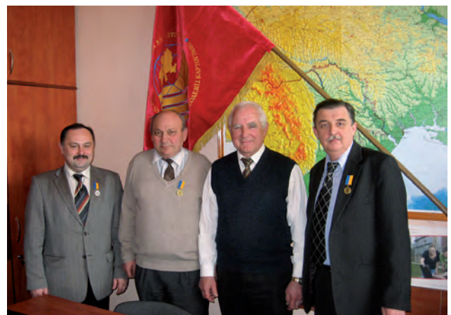
Під час нагородження членів ЗГТ в день професійного свята у Львові (2011)