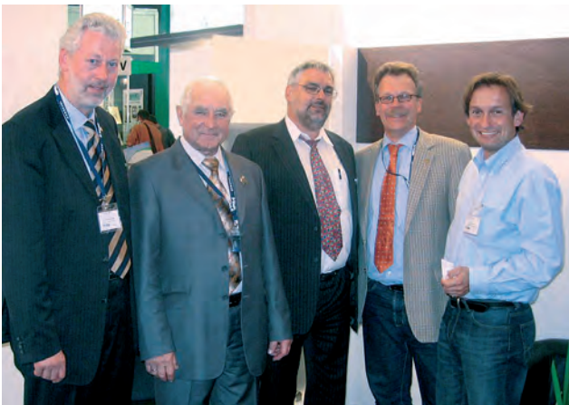
Зустрічі на INTERGEO (ФРН)