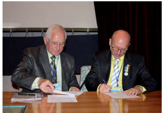
Підписання угоди про співпрацю з Товариством Словаччини