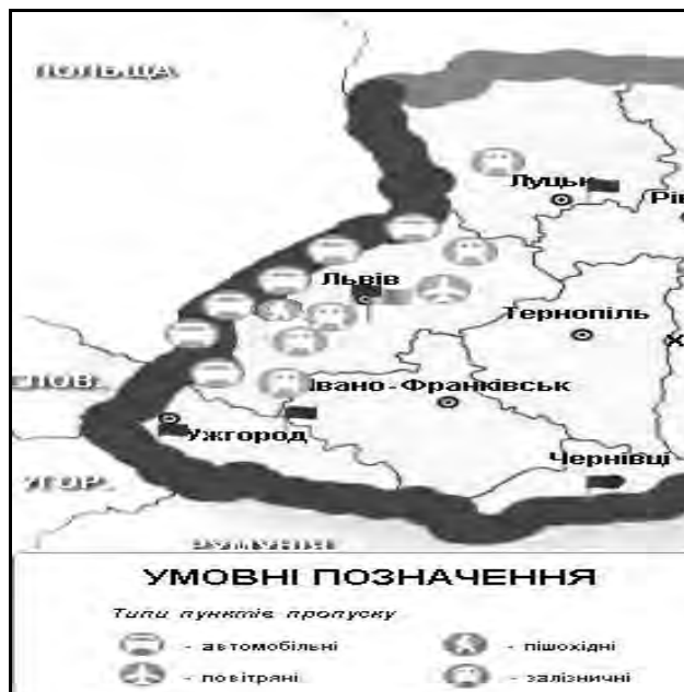
Рис. 2. Міжнародні пункти пропуску на українсько-польському кордоні