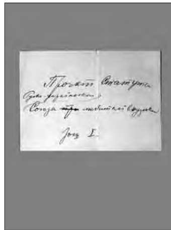
Рукопис проекту Статуту „Русько-українського союзу любителів музики“. Зошит I. Поч. XX ст.