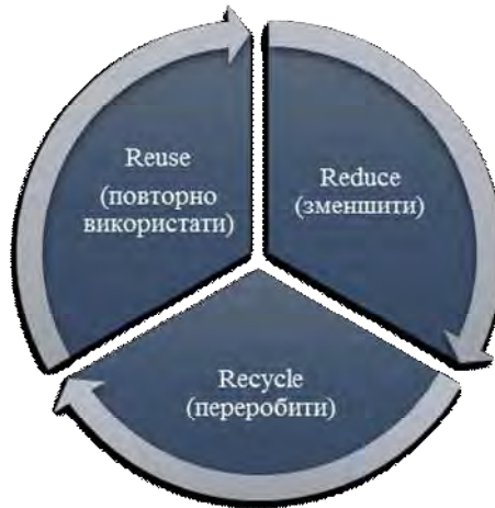
Рис. 1. Модель циркулярної економіки 3R

Найчастіше для трактування концепції циркулярної економіки використовують модель 3R (рис. 1) [16]: Reduce – зменшення обсягів використання ресурсів задля підвищення рівня ефективності процесу виробництва, Reuse – повторне використання викинутого товару у прийнятному стані іншим споживачем, Recycle – переробка матеріалів з метою отримання сировини такої ж якості або нижчої.