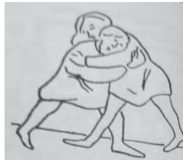
Рис. 4. Боротьба [1, с. 152]

Ігри на влучність. Одне з найвагоміших місць серед засобів фізичного виховання в період Київської Русі посідали фізичні вправи із використанням предметів, насамперед різноманітної зброї (списи, луки, мечі, бойові палиці та сокири, ножі, щити та ін.), а також предметів, які можуть використовуватись як зброя (каміння, палиці, мотузки, аркани тощо).