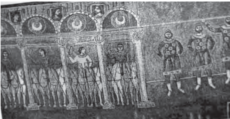
Рис. 6. Зображення іподрому періоду Київської Русі [1, с. 155]

Не менш важливими засобами фізичної підготовки молоді та воїнів залишалися природні фізичні вправи (ходьба, біг, стрибки, лазіння, перелітання, повзання, пірнання, плавання). Вони застосовувались для розвитку фізичних якостей людини і змалку, і в зрілому віці й використовувались у фізичному вихованні та військовою вишкোলі русичів [7]. Так, серед різновидів природних локомоцій для фізичної підготовки використовувався біг на 20–25 верст (21–27 км). Крім того, поширеними були швидкісне лазіння по деревах, перенесення на собі одного чи двох товаришів( з метою розвитку фізичних якостей: сили, витривалості, спритності) [8]. Використовувались також стрибки у довжину та висоту, з жердиною. С. Килимник також описує гру «Скакання через рів» (на відстань 1,5–2 метри) рис. 7 та стрибки догори через тичку. Він зазначає, що такі стрибки організовували у формі змагань з 2–4 і більше учасниками [8].