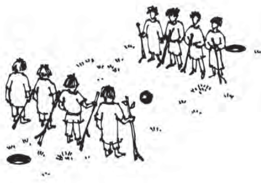
Рис. 1. Розташування гравців на полі

Археологічні знахідки, серед яких значне місце займали м'ячі різних розмірів та ваги, свідчать про те, що ігри з м'ячем в Київській Русі були доволі популярними. Для ігор з м'ячем передбачалася спеціальна організація ігрового простору: це було поле, поділене на 2 сектори, в яких розташовувались команди; позаду команд була проведена лінія, за яку потрібно було закотити ногами м'яч (рис. 2).