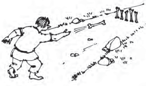
Рис. 5. Розташування предметів для гри «паці»

Ігри з палицею. Однією з популярних ігор була гра «Паці». «Паці» – нижні кістки баранячих чи коров'ячих ніг – розставляли впоперек вулиці, і влучними ударами потрібно було зруйнувати їх шеренгу (рис. 5). Важливим засобом фізичної підготовки були двобої на палицях.