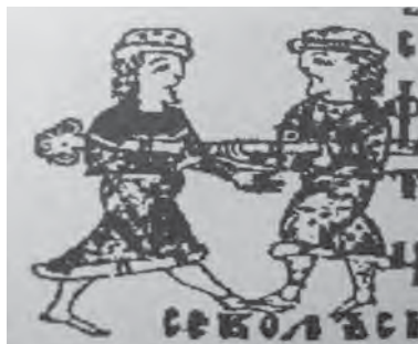
Рис. 3. Перетяги [1, с. 151]

Дуже великого поширення в Київській Русі набула боротьба. Вона була розповсюджена практично у всіх сферах життя людей. Поєдинки стали звичним явищем під час свят, на базарах, урочистих подіях (рис. 4).