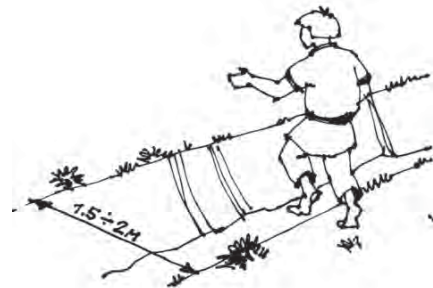
Рис. 7. Схема місця для стрибків через рів

На основі детального аналізу історичних документів та свідчень дослідників стає можливим відтворити сутність системи загартування в Київській Русі. Як відомо, слов'яни жили серед мальовничої природи, на чистому і свіжому повітрі. За давнім звичаєм, більшу частину року вони ходили в легкому одязі, без головних уборів, часто босими, з оголеним торсом, що давало добрий ефект від повітряних ванн.